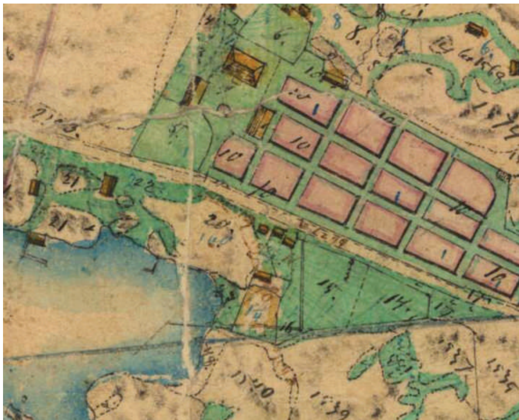
På kartan över Östanvik från 1863 syns till höger den U-formade ladugården som revs ett par år senare. Till vänster syns herrgårdens huvudbyggnad med sina två flyglar. I dag återstår bara den östra flygeln. Mellan herrgården och ladugården finns trädgårdsland.