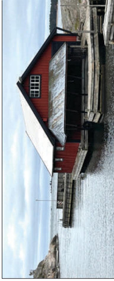
Figur 8. Två av husen samt båthuset som ingår i SEB:s semesteranläggning vid Villingehamn på västra sidan av Gillinge.

Detta var en kort presentation av historien för skärgårdshemmanet på Gillinge, främst från slutet av 1800-talet och framåt. Mycket mer finns att säga, inte minst beträffande de storslagna naturupplevelser som denna övärld erbjuder. Till detta får jag återkomma vid ett senare tillfälle.