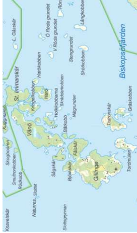
Figur 1. Kartbild över det gamla Gillingehemmanet med huvudöar som Gillinge, Vånö, Stora Immarskär, Harö, Tistronskär och Tordmullen. I det ursprungliga hemmanet ingick även Biskopsön med omkringliggande arkipelag längre ut åt öster.