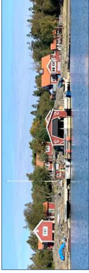
Figur 4. Bebyggelsen på Biskopsö.